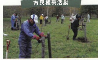
1983年の開始以来、市内小・中学校の敷地や各町内会にある公園に植樹等を行っています。これまでに1万人以上が参加し、1万本以上の苗木を植樹しました。