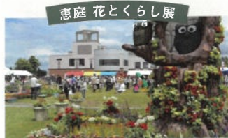
恵庭市を代表する花のイベント。花で装飾された会場では、花苗の販売、オークションやステージイベント等が開催されてきました。