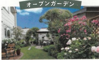
個人やお店などが、お庭を一定の期間公開。オープンガーデンの場所をまとめた花マップの制作や、市民ボランティア花ガイドによるオープンガーデンツアー等も行われてきました。